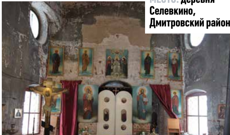
МЕСТО: деревня Селевкино, Дмитровский район

ДАРЬЯ ДЕНИСОВА mosregtoday@mosregtoday.ru